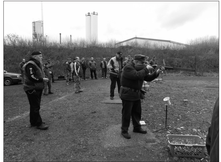
Teilnehmerrekord beim Club: 61 Schießsportbegeisterte von 19 Vereinen haben sich am traditionellen Trap-Pokalschießen des Schützen-Clubs Oschersleben über 25 Scheiben beteiligt. Die Platzierung auf den Rängen eins bis drei wurde erst im Stechen entschieden. Seite 22