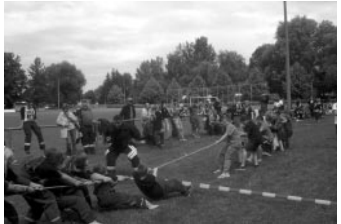
Ereignisreiches Jugendlager: Zum 12. Mal hat der KSV Halberstadt sein Kreisjugendlager durchgeführt, es fand im Juli in Zilly statt. Auf dem Programm standen unter anderem ein Sommerbiathlon-Wettkampf und ein sportlicher Vergleich mit der Jugendfeuerwehr (Foto). Seite 14