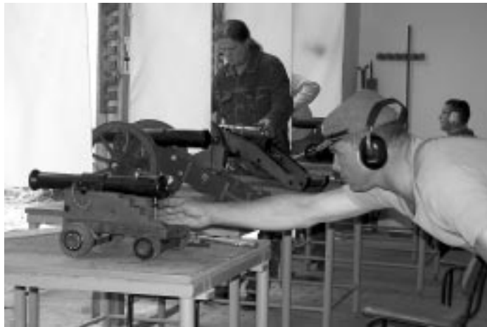
Andrang in Benndorf: Das zweite Mal hat der Verband Deutscher Schwarzpulver Kanoniere im Juni in Benndorf seine Meister in den Großgeschütz-Wettbewerben ermittelt. Wegen des großen Andrangs mussten diesmal drei zusätzliche Durchgänge angesetzt werden. Seite 22