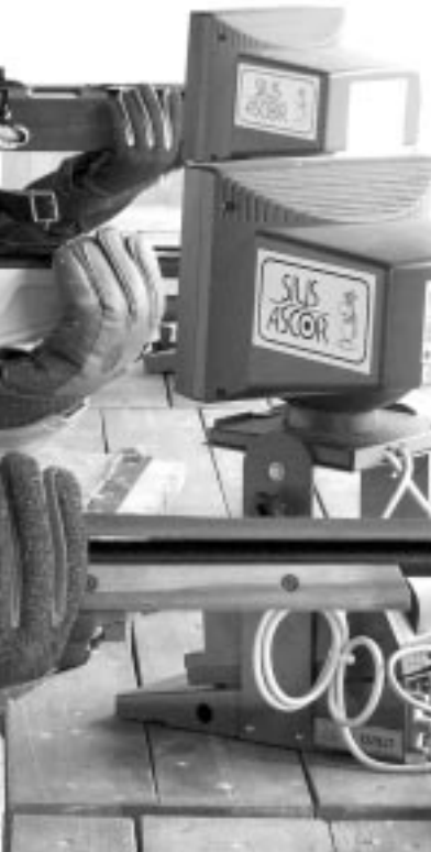
nun zwei Landesrekorde in der Einzelwertung, 2004 hatte er bereits den in der Schützenklasse erzielt. Seite 32